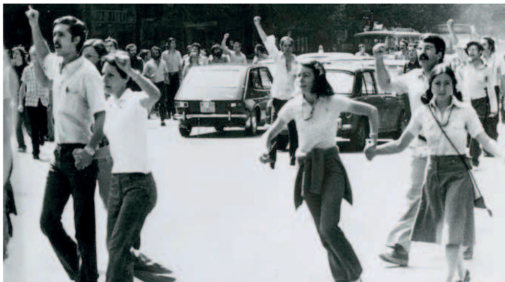
Manifestation pro amnistie à Madrid en 1976

Después de cada intervención (30 minutos) dispondremos de 15 minutos para el debate. Los idiomas que se manejarán en el congreso serán el español y el francés